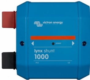
Lynx Shunt VE.Can